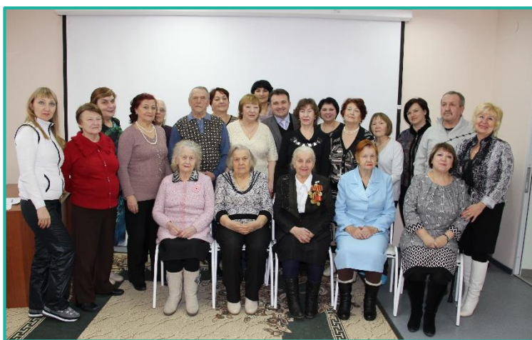
Рис.2. Круглый стол «Волонтеры. Вчера сегодня завтра»

По словам «серебряных» волонтеров, занятия добровольчеством открывает «второе дыхание». При непосредственном участии волонтеров «серебряного» возраста с 2016 г. и по март 2021 г. проведено 471 мероприятие, включающие беседы, акции, мастер-классы, квесты, концерты, конкурсы, викторины, спартакиады, спортивные фестивали.